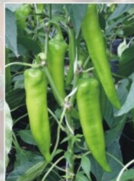
Titus F1 Koraiság, kiemelkedő darabszám és a TM2 ellenállóság párosítása.