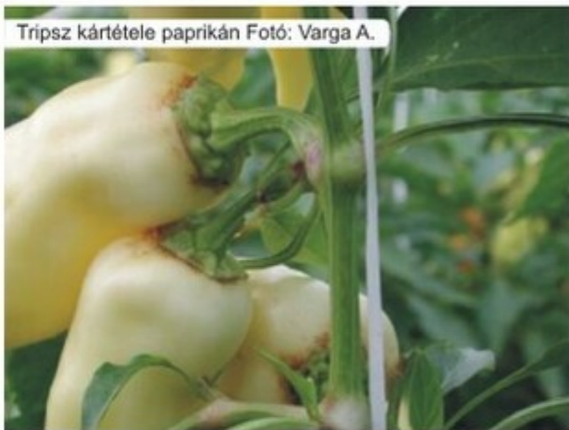
Tripsz kártétele paprikán

A hajtattott zöldség termesztés sikerét - szinte az egész tenyészidőszakban számos, gyorsan fejlődő, soknemzedékű szívó és aknázó kártevő veszélyezteti.