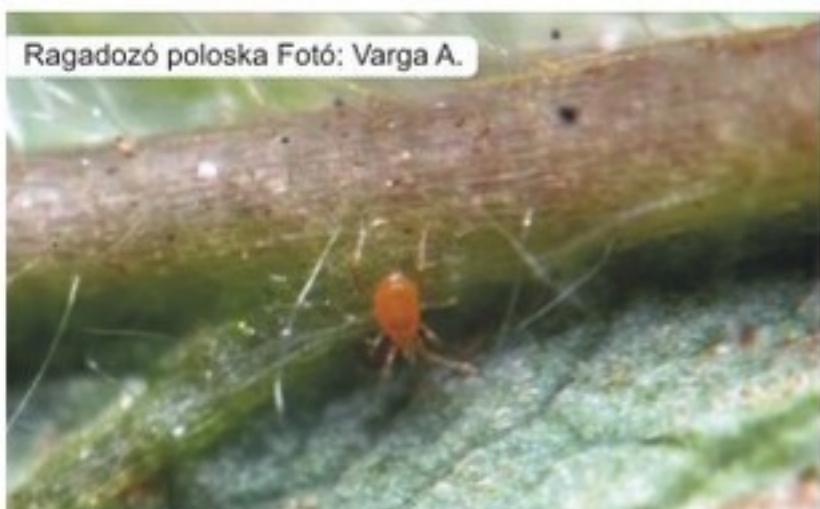
Ragadozó poloska

Hatásuk tartós, ezért a szokásosnál kevesebb permetezéssel növényeink kártétel- és vírusmentesek maradnak.