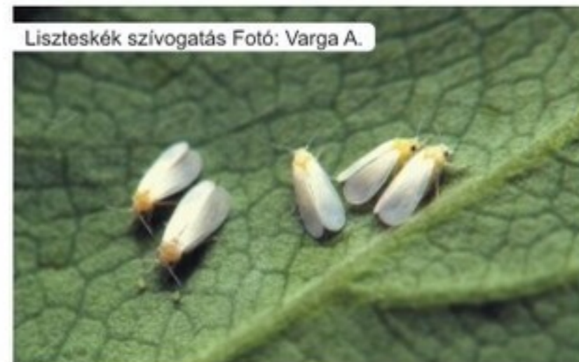
Liszteskék szívogatás

Az Actara hatásspektruma a legszélesebb, ezért indítsuk ezzel a védelemi szezont!