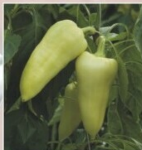
Flexum F1 Vállas, vastag húsú súlyos terméseket nevelő, jól termesztendő fajta.