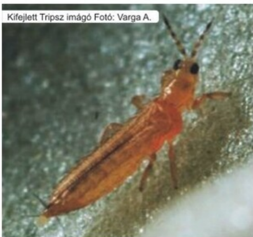
Kifejlett Tripsz imágó

A termesztők számára nem kis feladat, a levéltetvek, liszteskék, atkák, tripszek és aknázórovarok támadásával szemben felvenni a harcot. Nemcsak szívogatásuk , közvetlen kártételük veszélyes, de ennél súlyosabb gondot okoz vírusátvivő szerepük . A Syngenta széles választékából az Actara, a Chess és a Vertimec egyesíti magában mindazt, amire a termesztőnek a fent említett, nehezen írható kártevők ellen éppen szüksége van.