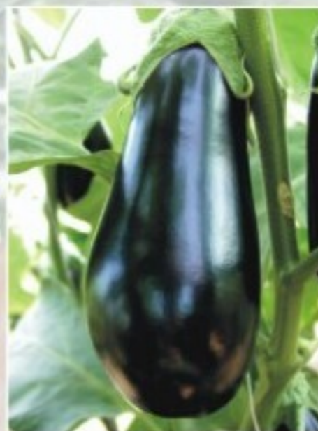
Epic F1 Korai, cseppalakú, ToMV ellenálló fajta. Termései átlagosan 21x10 cm-esek.