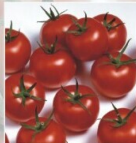
Flexion F1 a paradicsomok új generációja, kiváló bogyóminőség, pultos csészelevelű és teljes rezisztenciasor együttese.